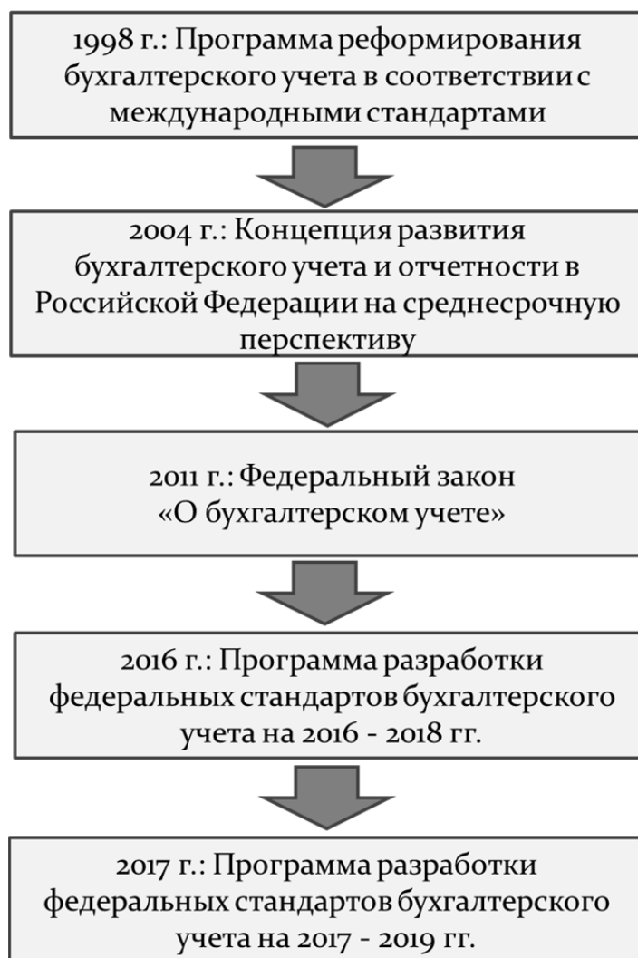
Рис. 1 / Fig. 1. Ключевые нормативные документы, регламентирующие реформу российского бухгалтерского учета / The most important normative documents regulating the Russian accounting reform

• 10 представителей субъектов негосударственного регулирования бухгалтерского учета и научной общественности (из них не менее 3 членов подлежат ротации 1 раз в 3 года).